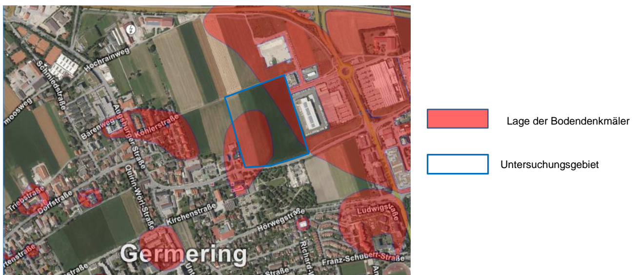
Abbildung 2: Lage Bodendenkmäler gem. Bayerischen Landesamtes für Denkmalpflege [30]

Gemäß des Bayerischen Landesamt für Denkmalpflege [30] befindet sich im westlichen Teil der Untersuchungsfläche eine Siedlung der späten Bronzezeit und der frühen Urnenfelderzeit, der Hallstattzeit und der mittleren und späteren römischen Kaiserzeit. Weiterhin befinden sich dort Brandgräber aus der späten Bronze- oder Urnenfelderzeit und Körpergräber der späten römischen Kaiserzeit (Denkmalnummer: D-1-7834-0027[30]). Im östlichen und nordöstlichen Teil der Untersuchungsfläche befindet sich eine Siedlung vorgeschichtlicher Zeitstellung, u.a. des Neolithikums, der Bronzezeit, der Urnenfelderzeit, der Hallstattzeit und der Latènezeit, eine verebnete Viereckschanze der späten Latènezeit, eine Siedlung der römischen Kaiserzeit und des frühen Mittelalters sowie Brand- und Körperbestattungen der Bronzezeit, der Urnenfelderzeit, der Hallstattzeit, der Latènezeit und der römischen Kaiserzeit (Denkmalnummer: D-1-7834-0295, [30]).