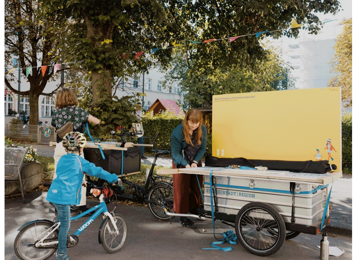
Dialog zu den Münchner Sommerstraßen, München