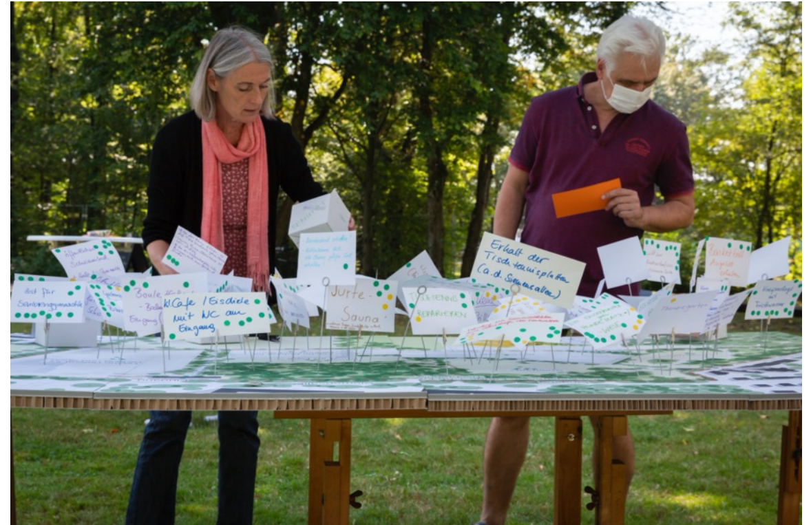
Öffentlichkeitsbeteiligung zum Siemens-Sportpark, München