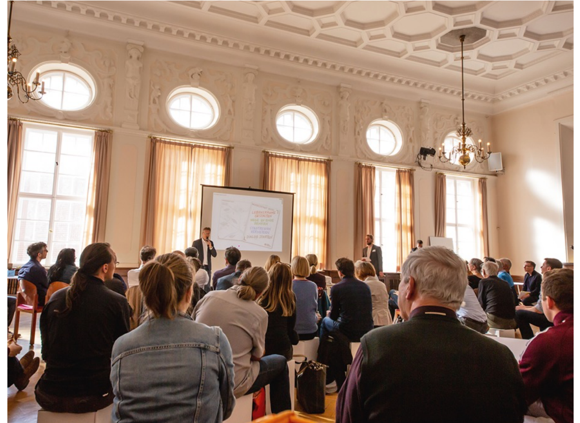
Mobilitäts-Werkstatt, Beteiligungsveranstaltung zum Münchner Mobilitätsplan, München