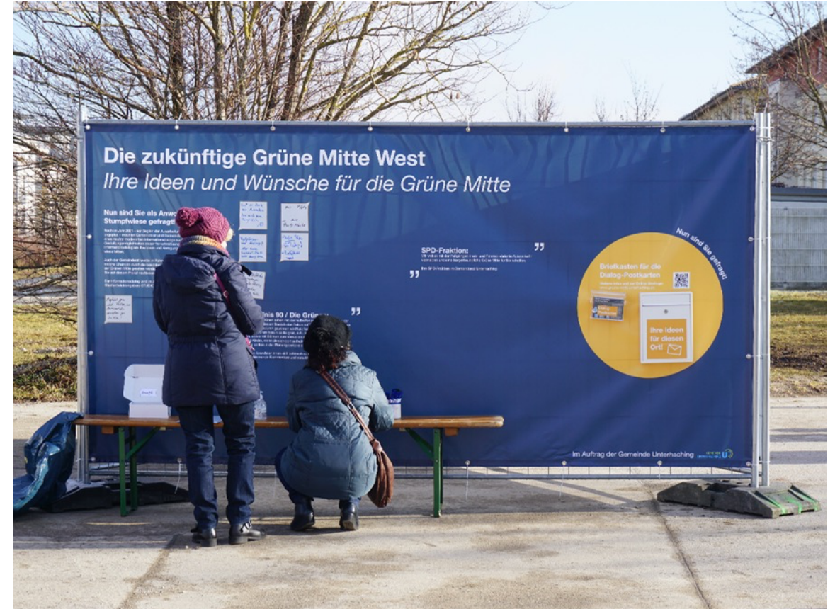
Beteiligungsprozess für die Grüne Mitte West Unterhaching , München